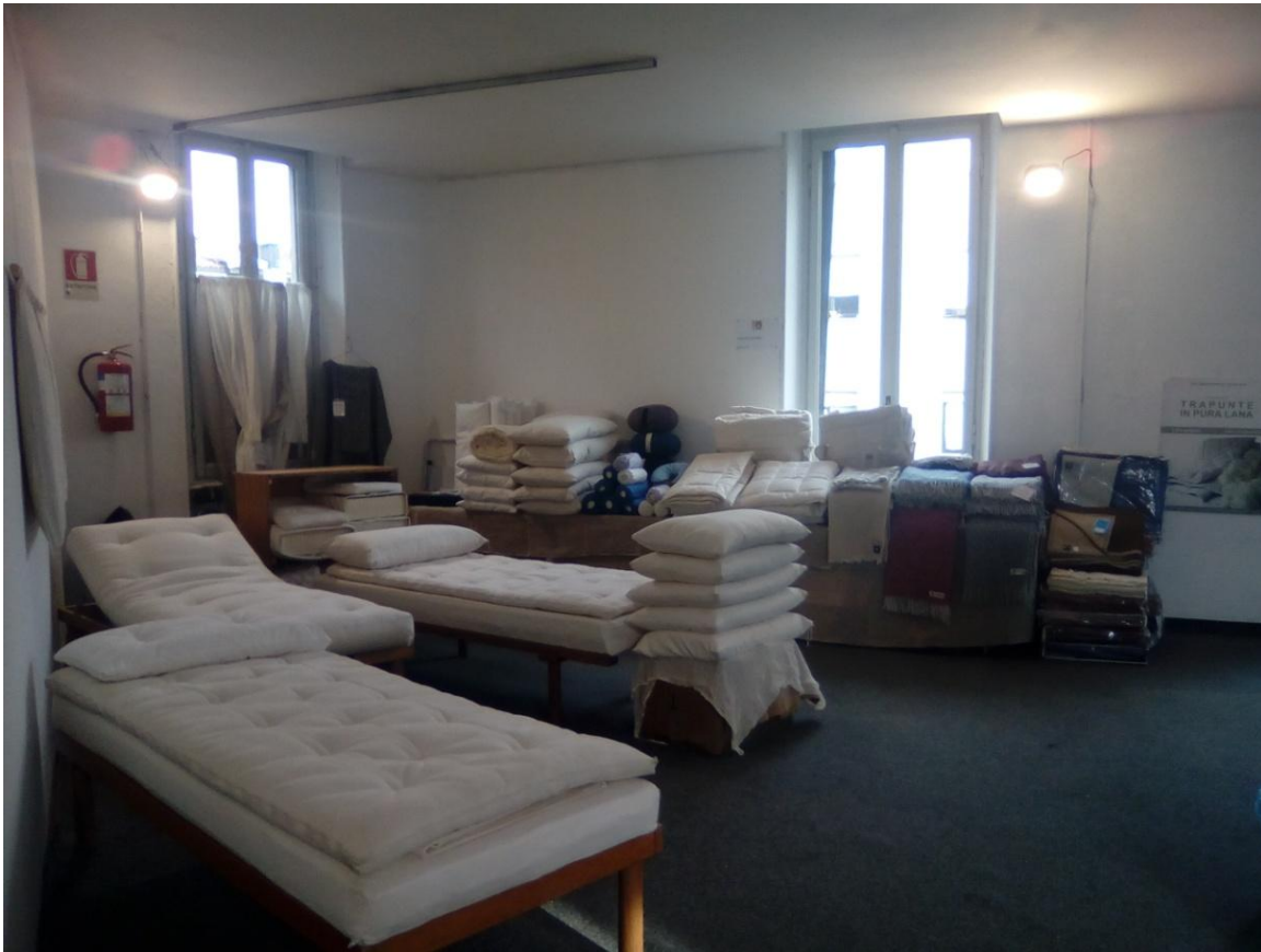
Spazio prova e scelta dei materiali e delle soluzioni personalizzate