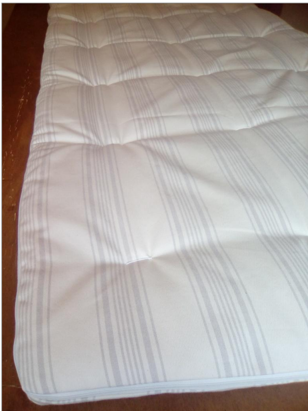
Coprimaterasso in cotone biologico e lana vergine

Laboratorio e spazio prova e ritiro a Lecco